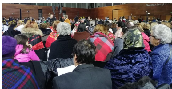
Grupo CAISA no Multiusos de Guimarães

A CAISA presenteou o Pavilhão Multiusos com a sua presença, numa atuação conjunta do Projeto Raízes, Projeto MoveBrito e Grupo de Cantares do Centro de Convívio e Atividades de Vermil, com direção musical da CAISA.