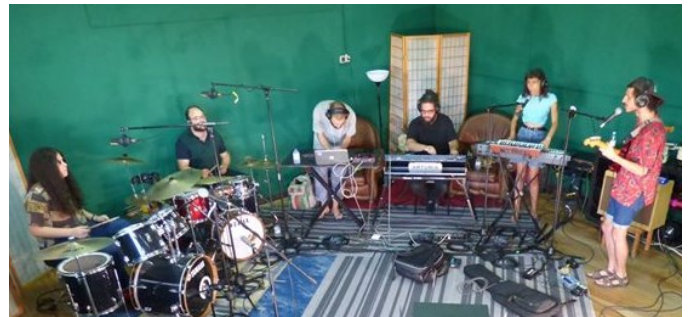
Unsafe Space Garden em concerto no CLAV

a impressão digital das canções: bonecas russas que não sabem quando acabam, mas que reconhecem que precisam umas das outras. A conclusão é sempre que não existe nenhuma e é daí que Unsafe Space Garden se ergue, em todo o seu esplendor de vozes, cores, teatralidade, pungência e fragilidade.