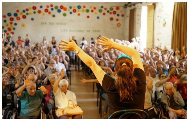
Dia do Idoso em 2018

Este ano, sem festa, sem convívio, sem abraços, mas com a esperança de sempre de que no próximo ano estaremos juntos como até então e que em conjunto celebraremos a vida, tal qual eles merecem.