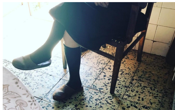
Uma das idosos que recebe auxílio de um cuidador informal

A CAISA tem o Gabinete de Apoio ao Cuidador ao seu dispor, se precisa de ajuda, ou pretende esclarecer alguma dúvida, contacte o 925 531 897