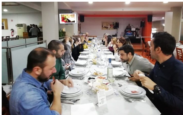
Jantar de reis da equipa CAISA

Em 2020, a CAISA prometeu reforçar a solidez do trabalho desenvolvido quer ao nível social, quer educativo, quer cultural.