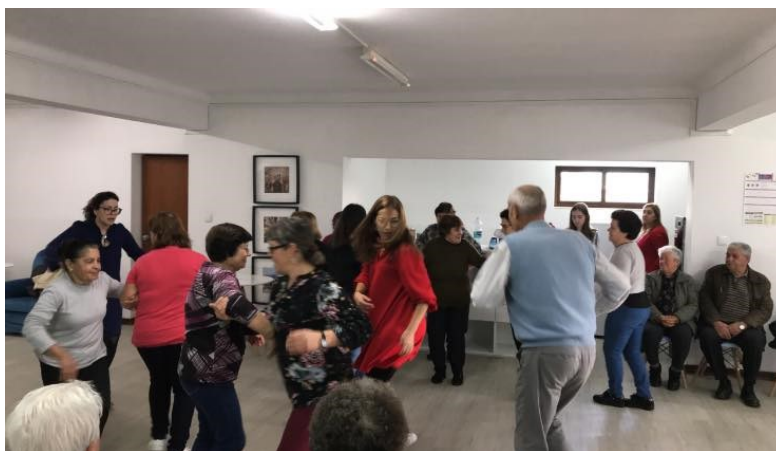
Chã Dançante no CCAV

Foi ainda durante toda a semana, trabalhado o conceito “amor” e abordado nas suas várias dimensões, quer pelo amor ao conjugue, quer à família, aos amigos e até aos vizinhos. O amor que é um sentimento tão forte e que abarca sentimentos positivos está presente no dia-a-dia dos idosos que participam ativamente nas diversas atividades da CAISA.