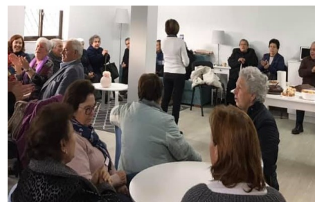
Lanche convívio de reis no CCAV