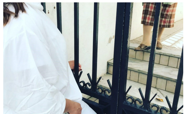
Visita domiciliária a uma idosa.

por todos com enorme apreço, onde foram partilhados anseios, medos e desejos bem como a saúde do Mundo fora das suas casas. Na dificuldade em sair de casa e deslocar-se, tem sido ainda prestado auxílio na realização das compras, assim como na compra de medicação e articulação de consultas e exames médicos, com vista a facilitar o normal decorrer das coisas e diminuir o afastamento daquilo que lhes é necessário.