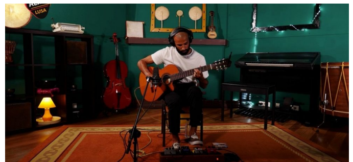
Grutera em concerto no CLAV

balho. O primeiro álbum com banda, “Behind The Walls”, editado em abril de 2016 foi nomeado, em novembro do mesmo ano, para os prestigiados The Independent Music Awards em Nova Iorque que contou com Tom Waits e Suzanne Vega entre os jurados. Atualmente, encontram-se a preparar o seu segundo álbum de originais.