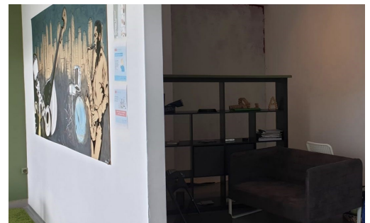
Um dos espaços renovados do TOCA

Apesar de tudo, as aulas funcionaram com normalidade. As pequenas obras, em nada as afetaram. Apesar da situação pandémica que vivemos sempre foi seguro dirigir-se ao TOCA, onde poderá deliciar-se com a qualidade do espaço renovado e dos corpo docente, bem como colaboradores que a integram.