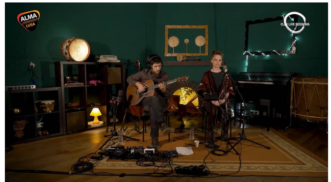
Hot Air Balloon em direto no canal Alma Lusa

Poderá assistir ao formato televisivo no canal por cabo Alma Lusa na posição n° 139 da MEO em Portugal .