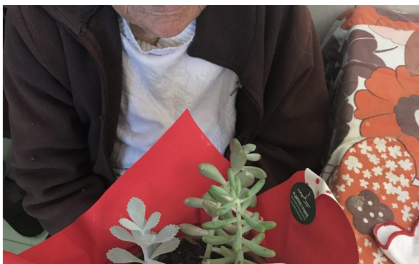
Visita domiciliária para parabenizar uma idosa.