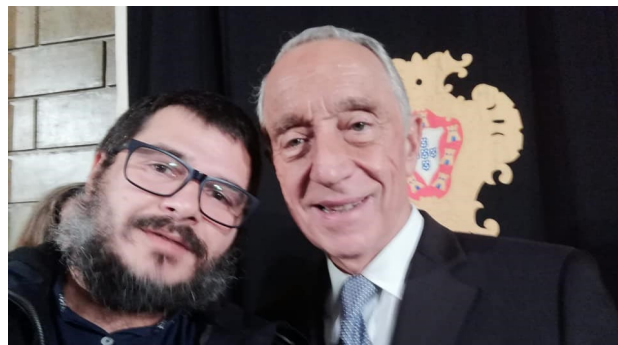
Presidente da CAISA acompanhado do Sr. Presidente da República Marcelo Rebelo de Sousa

A CAISA integrou o Ano Nacional da Colaboração com o projeto Pequenos Cuidadores que visa a aproximação de gerações, combatendo o isolamento social mas sobretudo trabalhando a educação para a desmistificação do ser idoso e a importância do cuidar. É com base numa colaboração interinstitucional que este projeto faz frente a problemas complexos potenciando respostas mais eficazes e mais eficientes aos desafios com que a comunidade se depara.