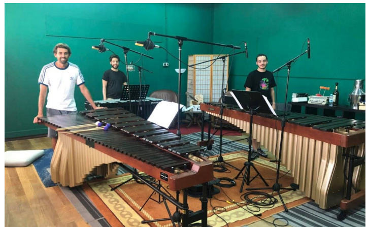
Músicos em gravação

A edição das obras conta com o apoio do Município de Guimarães, Município de V. N. Famalicão e da União de Freguesias de Airão Santa Maria,